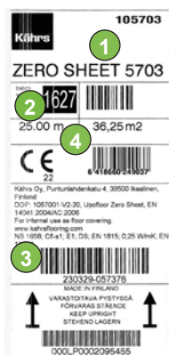
Beispiel Etikett auf der Bahnenware Zero Sheet mit (1) Farb-, (2) Chargen- und (3) Rollen-Nr., (4) Rollenlänge und Menge.

Bei der Verlegung von Bahnen und Fliesen in einem Raum, dürfen nur chargengleiche Waren aus einer Fertigung verlegt werden. Bei der Bestellung ist darauf zu achten, dass Chargen und farbgleiches Material bestellt werden. Leichte Farbverläufe sind innerhalb einer Charge jedoch möglich.