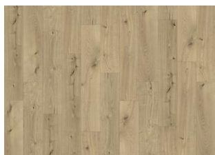
Coconino - Dry Back