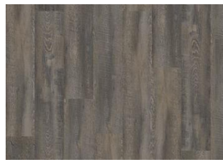
Daintree - Dry back