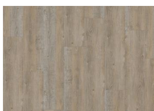
Cormorant - Dry back