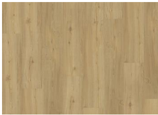
Oulanka - Dry Back