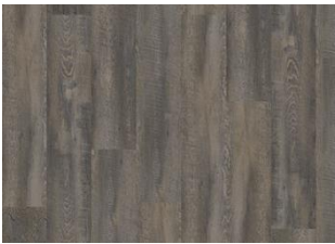
Daintree - Dry back