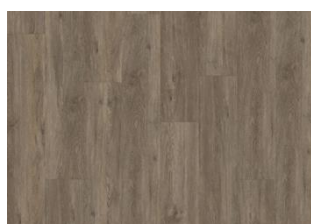
Sarek - Dry back