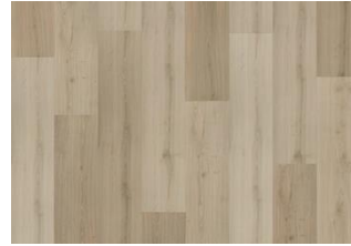
Kilsbergen - Dry Back