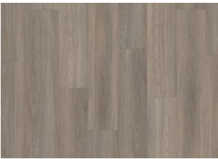
Whinfell - Dry back