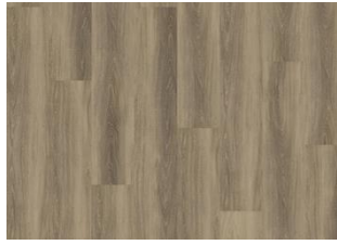
Hanmer - Dry Back