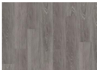
Stanton - Alustaan liimattava