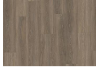
Tiveden - Dry back