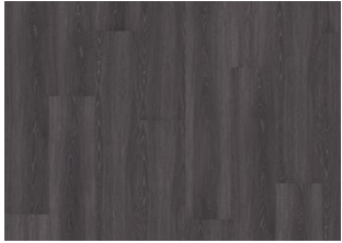
Calder - Dry back