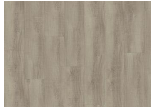
Snowdonia - Dry back