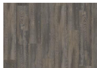
Daintree - Dry back