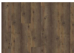
Komi - Dry back