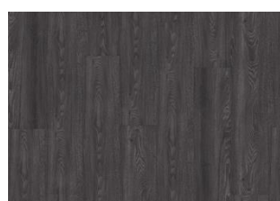
Humboldt - Dry back