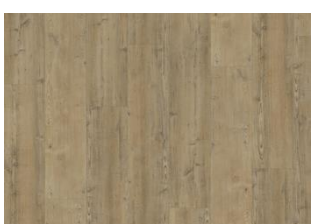
Waipoua - Dry back