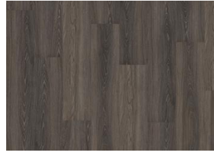
Tongass - Dry back