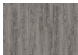
Plitvice - Dry back