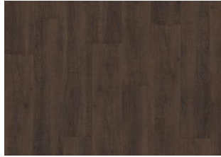
Burnham - Dry back