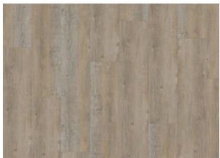
Cormorant - Dry back