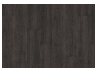
Valdivian - Dry back