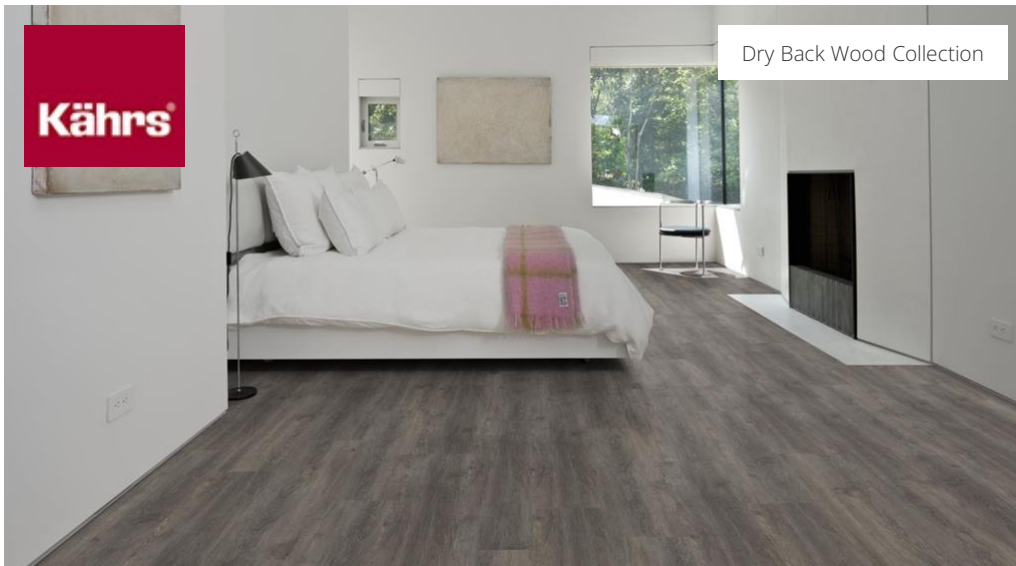
Dry Back Wood Collection