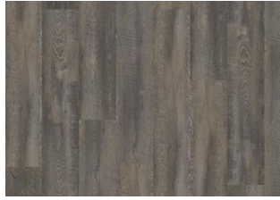
Daintree - Dry back