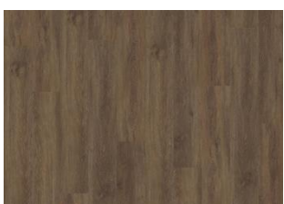
Belluno - Dry back