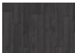
Schwarzwald - Dry back