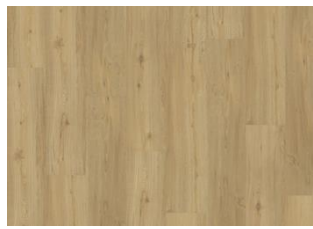
Oulanka - Dry Back