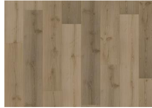
Foloi - Dry Back