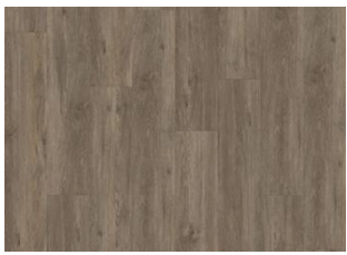
Sarek - Dry back