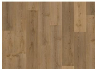
Akkelis - Dry Back