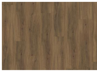
Redwood - Dry back