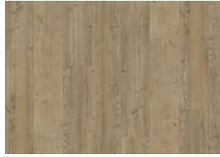
Waipoua - Dry back