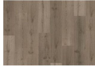
Blaiken - Dry Back