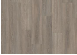
Whinfell - Dry back