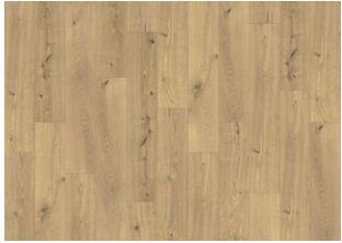
Thuringian - Dry Back