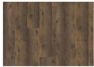
Komi - Dry back