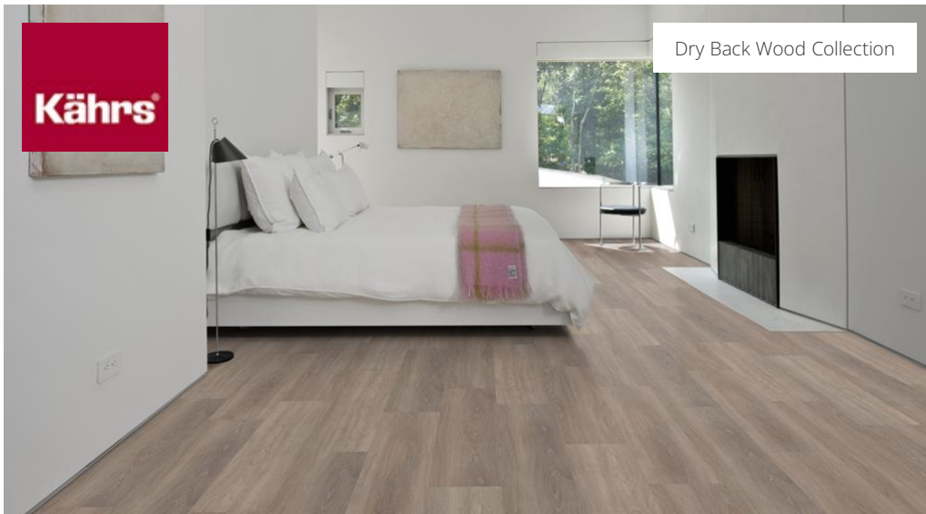
Dry Back Wood Collection