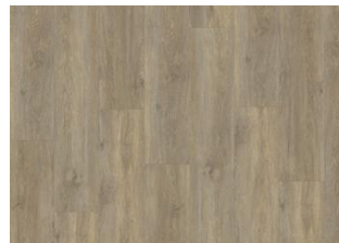
Taiga - Dry back