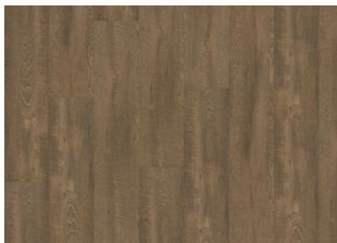
Durmitor - Dry back