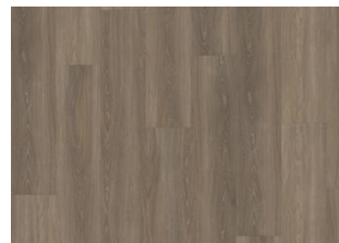
Tiveden - Alustaan liimattava