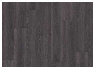
Calder - Alustaan liimattava