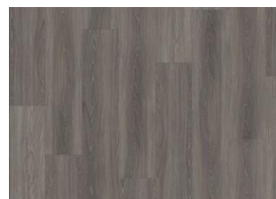
Wentwood - Alustaan liimattava