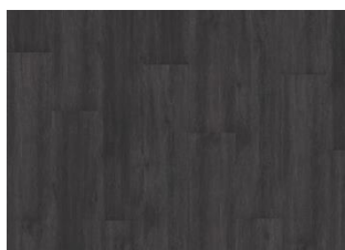
Schwarzwald - Alustaan liimattava