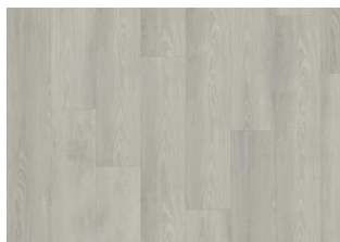
Yukon - Alustaan liimattava