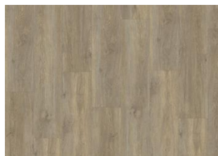
Taiga - Alustaan liimattava