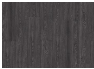
Humboldt - Alustaan liimattava