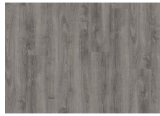
Plitvice - Alustaan liimattava