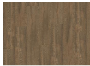
Durmitor - Alustaan liimattava