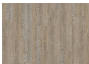
Cormorant - Alustaan liimattava