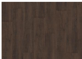
Burnham - Alustaan liimattava