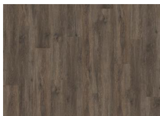
Saxon - Alustaan liimattava