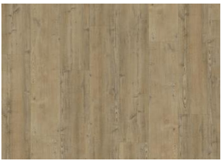
Waipoua - Alustaan liimattava