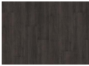
Valdivian - Alustaan liimattava