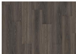
Tongass - Alustaan liimattava