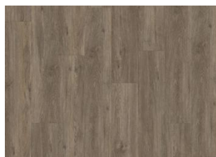
Sarek - Alustaan liimattava