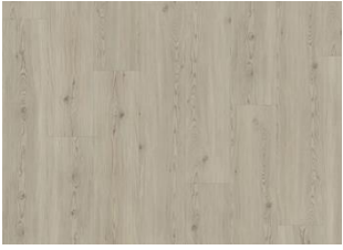
Triglav - Alustaan liimattava