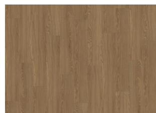
Sherwood - Alustaan liimattava