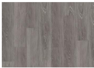
Stanton - Alustaan liimattava