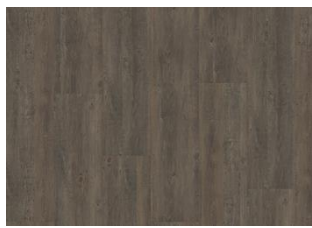
Gorbea - Alustaan liimattava