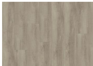
Snowdonia - Alustaan liimattava