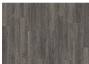
Niagara - Alustaan liimattava