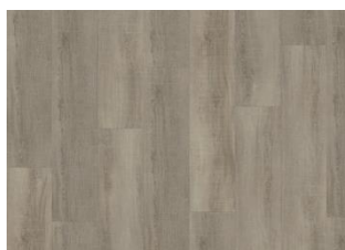
Riva - Alustaan liimattava