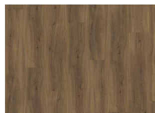
Redwood - Alustaan liimattava