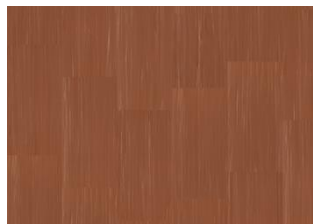
Quartz Lines 8244 Tigereye Red