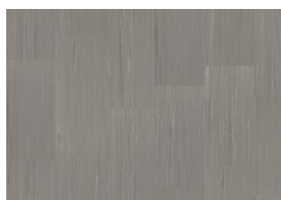
Quartz Lines 8203 Gabbro Grey