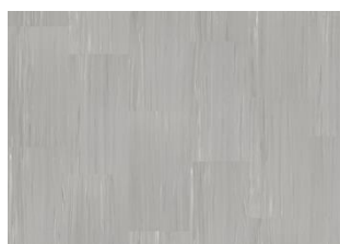
Quartz Lines 8214 Thunder