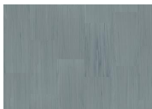
Quartz Lines 8253 Blue Chalcedony