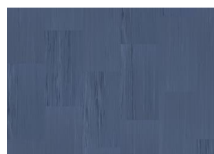
Quartz Lines 8257 Blue