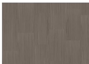
Quartz Lines 8224 Hypersthene Ash