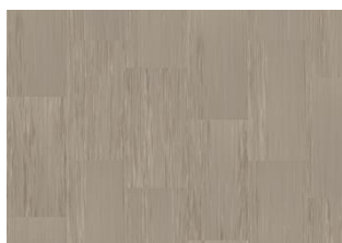
Quartz Lines 8223 Modest Cancrinite