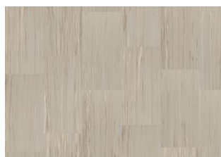
Quartz Lines 8222 Nude Limestone