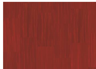
Quartz Lines 8249 Crocoite Red