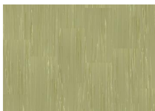
Quartz Lines 8265 Prosperous Peridot