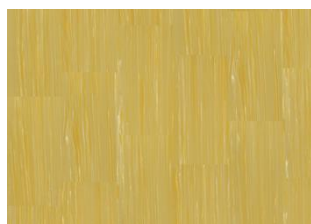
Quartz Lines 8229 Amber Yellow