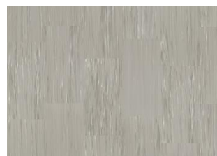
Quartz Lines 8202 Conglomerate Grey