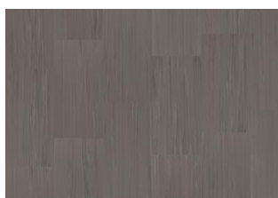
Quartz Lines 8204 Scoria Grey