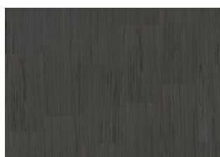
Quartz Lines 8217 Zebra Jasper