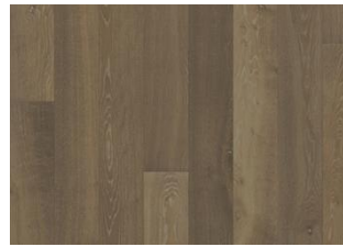
Eiche Nouveau Greige