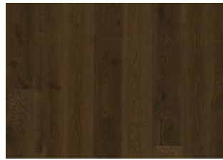
Eiche Nouveau Tawny