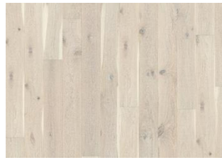
Eiche Nouveau Lace