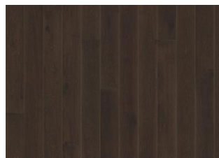
Eiche Nouveau Black