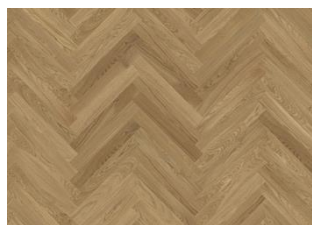
Eiche Studio CD