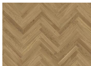
Eiche Studio CD