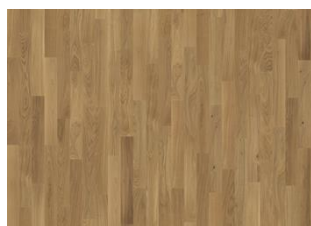
Eiche Studio CD