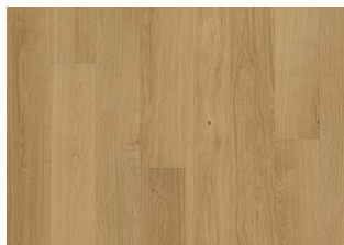
EG DUBLIN OLIE