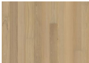
Eik Honey Oat