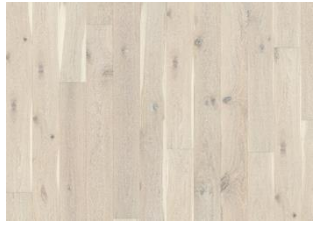
Eiche Nouveau Lace