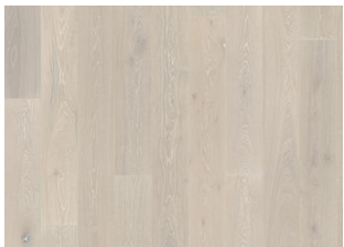
Eiche Nouveau Snow