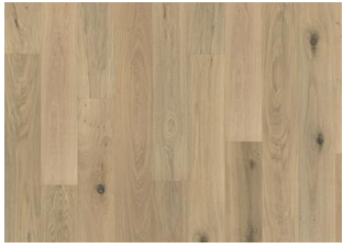
Eiche Nouveau Whisper