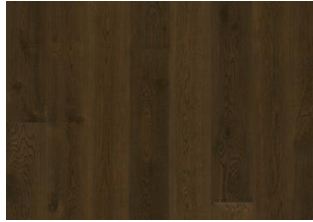
Eiche Nouveau Tawny