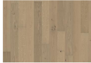
Eiche Nouveau White