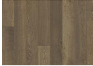
Eiche Nouveau Greige