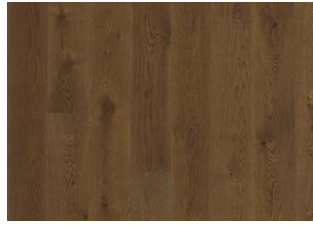
Eiche Nouveau Rich