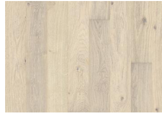
Eiche Nouveau Blonde