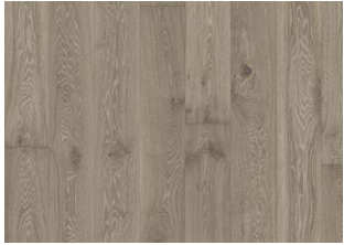
Eiche Nouveau Gray