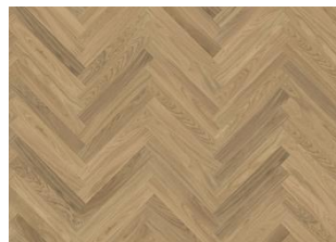
Rovere Studio AB White