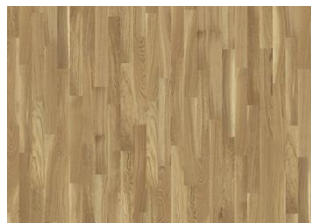
Studio Rovere CC 11 mm