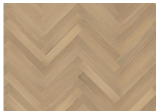
Rovere Studio AB White