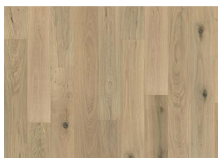
CHÊNE NOUVEAU WHISPER