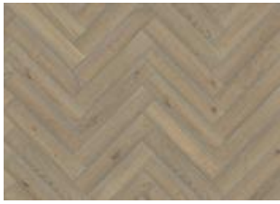
Fischgrat Eiche CC Vintage Weiß