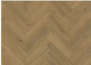
Fischgrat Eiche CD Grau