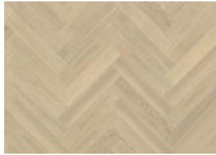
Fischgrat Eiche AB Weiß