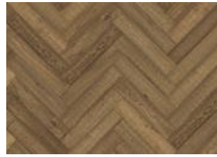
Fischgrat Eiche CD Vintage geräuchert