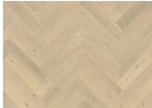
Fischgrat Eiche CD Weiß