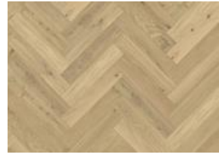
Fischgrat Eiche CC Dim