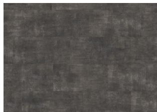
Steele - 5 mm lukkopontillinen