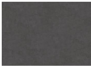
Schwarzhorn - 5 mm lukkopontillinen