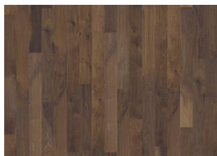
Noce Americano Groove