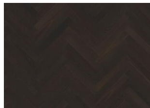
Räuchereiche Studio AB