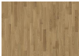
Eiche Studio CD