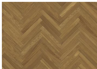
Eiche Studio AB