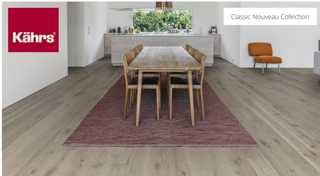
Classic Nouveau Collection