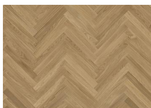
CHÊNE STUDIO AB