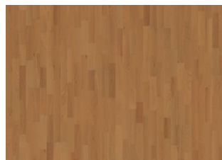
Ciliegio americano Savannah