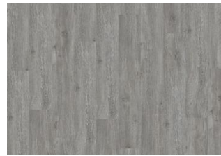
XPRESSION Cool Grey