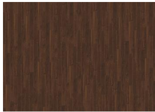
XPRESSION French Walnut