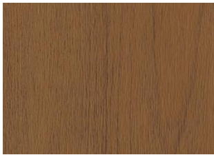
XPRESSION American Cherry