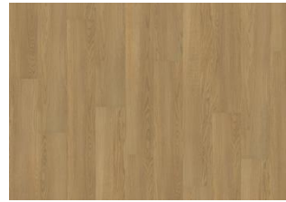
XPRESSION Golden Oak