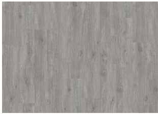
XPRESSION Warm Grey