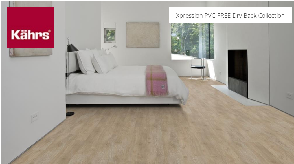
Xpression PVC-FREE Dry Back Collection