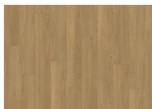
XPRESSION Golden Oak