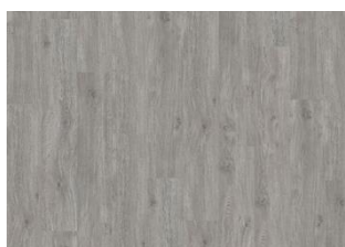
XPRESSION Warm Grey