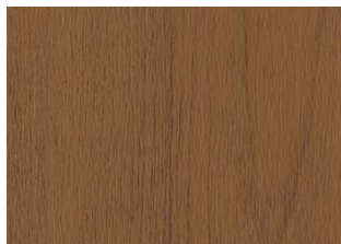
XPRESSION American Cherry