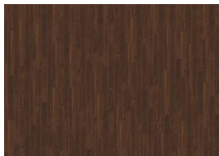
XPRESSION French Walnut