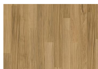
Pure Oak 1S Wide