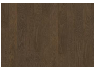
Cocoa Bean 1S Wide