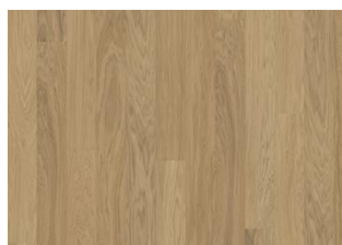
Light Suede Landhausdiele