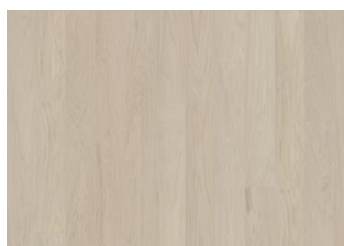
Coconut Cream Landhausdiele