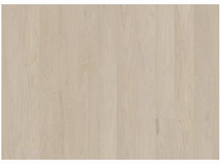
Coconut Cream 1S Wide