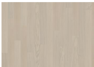
Coconut Cream 1S Narrow