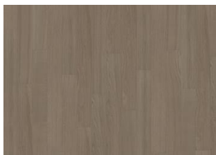
Earl Grey 1S Narrow