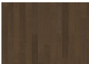
Cocoa Bean 1S Narrow