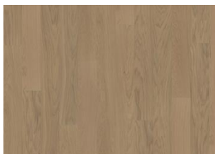
Butterscotch 1S Wide