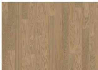
Light Suede 1S Narrow