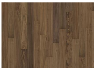
Pure Walnut 1S Narrow