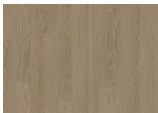
Driftwood 1S Wide