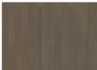
Faded Black 1S Narrow