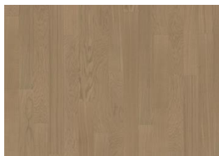
Butterscotch 1S Narrow