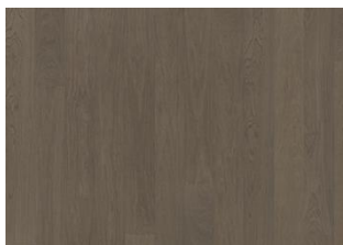
Faded Black 1S Wide