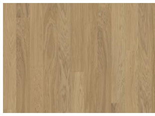
Light Suede 1S Wide