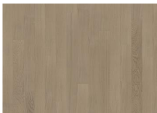
Driftwood 1S Narrow