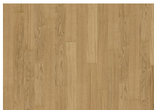
Pure Oak 1S Narrow