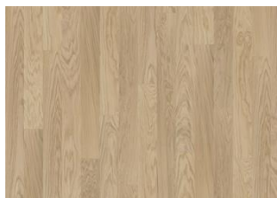
Whole Grain 1S Narrow