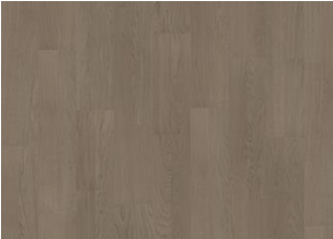
Earl Grey 2-strip