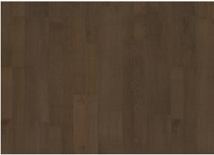
Cocoa Bean 2-strip