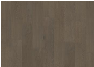
Faded Black 2-strip