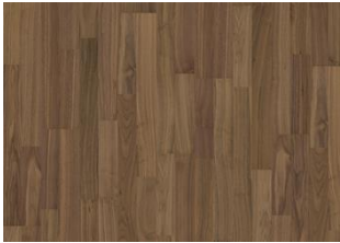
Pure Walnut 2-strip