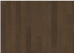
Cocoa Bean Narrow