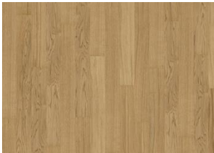
Pure Oak Narrow