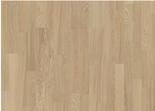
Whole Grain 2-strip