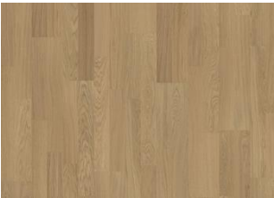
Light Suede 2-strip