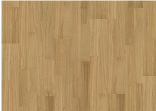
Pure Oak 2-strip