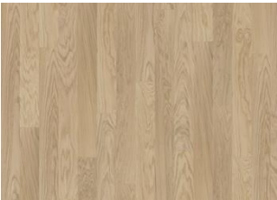
Whole Grain Narrow