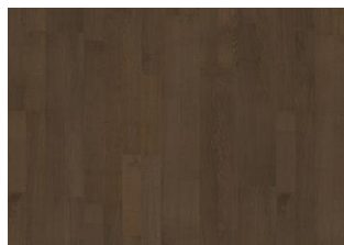
Cocoa Bean 2-Stab