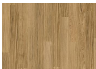
Pure Oak Landhausdiele