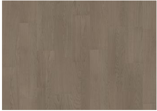
Earl Grey 2-Stab