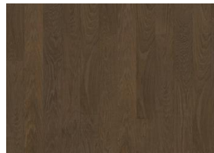
Cocoa Bean Landhausdiele