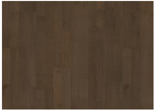
Cocoa Bean 2-Stab