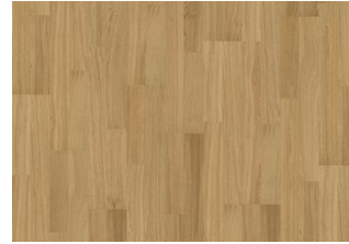
Pure Oak 2-Stab