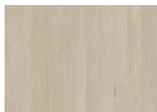
Coconut Cream Landhausdiele