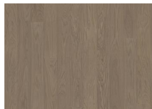
Earl Grey Landhausdiele