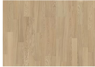
Whole Grain 2-Stab