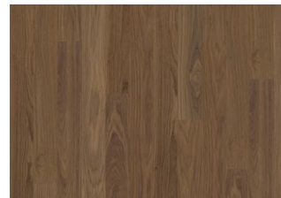
Pure Walnut Landhausdiele