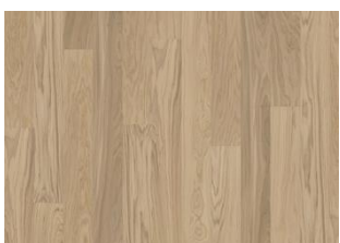
Whole Grain Landhausdiele