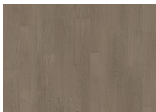
Earl Grey 2-strip