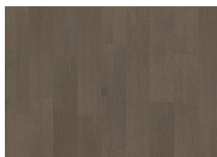
Faded Black 2-strip