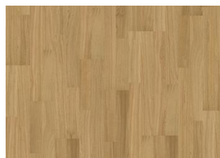
Pure Oak 2-strip