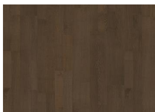
Cocoa Bean 2-strip