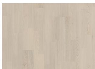
Coconut Cream 2-strip