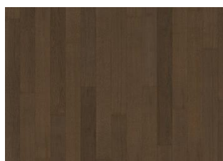
Cocoa Bean Narrow