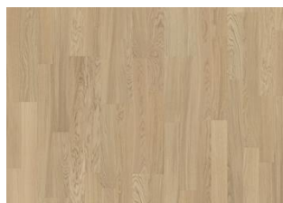
Whole Grain 2-strip