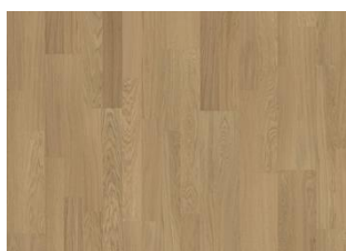
Light Suede 2-strip