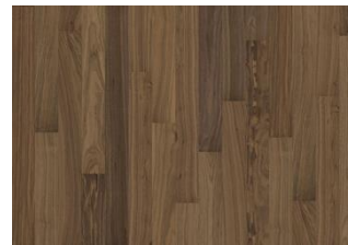
Pure Walnut 1S Narrow