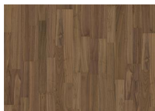
PURE WALNUT 2-STRIP