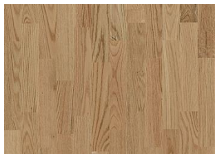
Chêne Rouge Nature