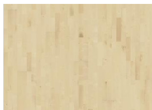
Acero di montagna Gotha