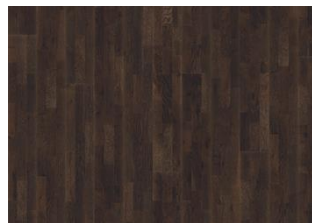
Rovere Lava (caffè)