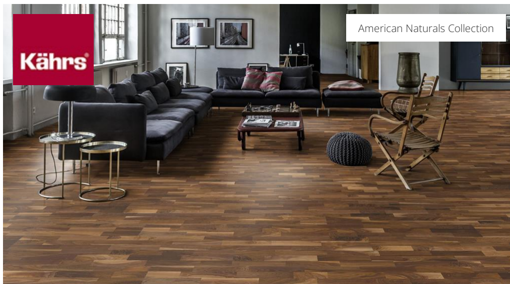
American Natural Collection