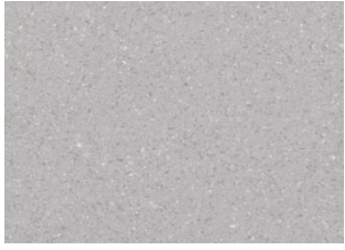
ZERO TILE 5102 Cape Cod