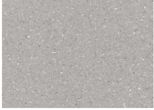
ZERO TILE 5111 Silver Grey