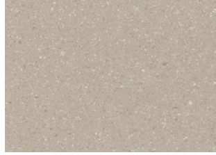
ZERO TILE 5122 Dusty