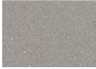
ZERO TILE 5112 Concrete