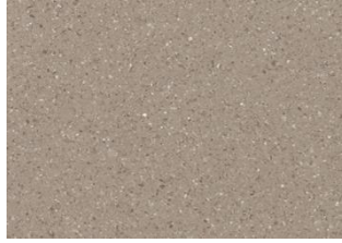
ZERO TILE 5123 Morocco