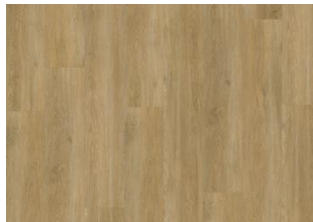
Sapo - 6 mm lukkopontillinen