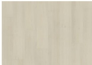
Aspen - 6 mm lukkopontillinen