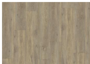
Taiga - 6 mm lukkopontillinen