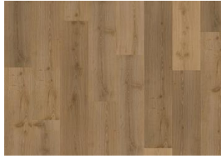
Akkelis - 6 mm Rigid Click