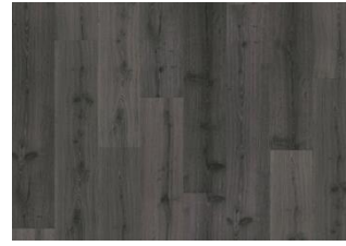
Didnok - 6 mm Rigid Click