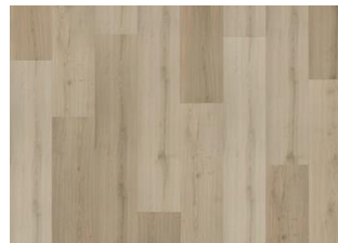
Kilsbergen - 6 mm Rigid Click