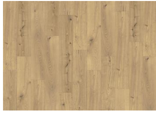
Thuringian - 6 mm Rigid Click