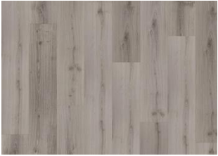
Otago - 6 mm Rigid Click