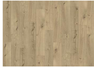
Coconino - 6 mm Rigid Click