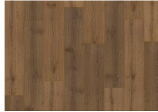
Takayna - 6 mm Rigid Click