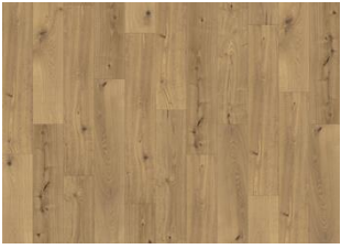
Moesgaard - 6 mm Rigid Click