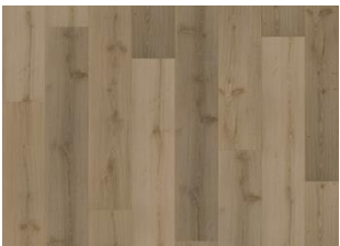
Foloi - 6 mm Rigid Click