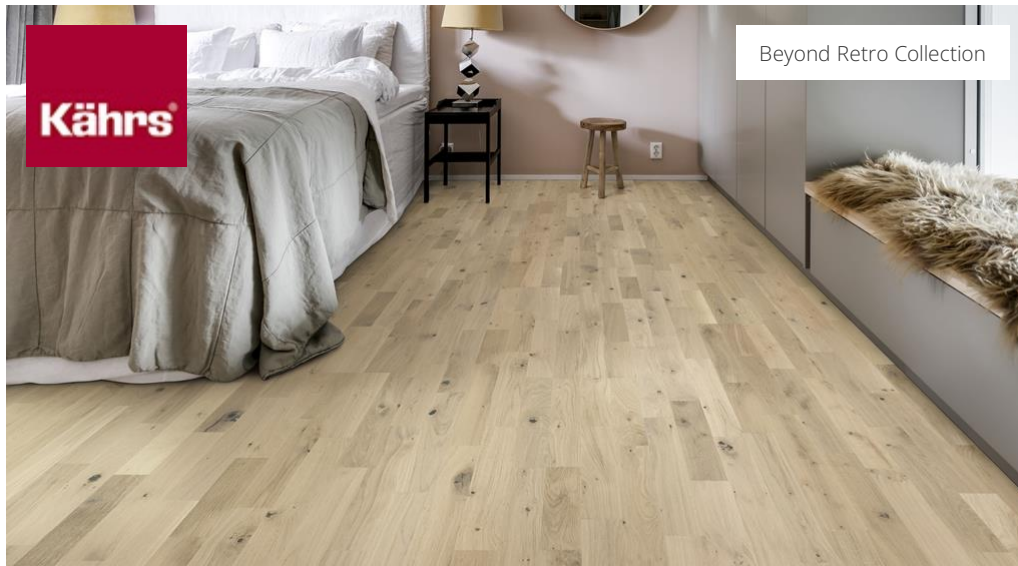
Beyond Retro Collection