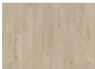
Chêne Loft White Plank