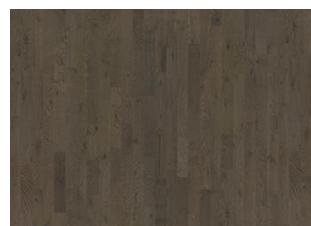
Charcoal Light Strip