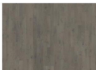
Pearl Grey Strip