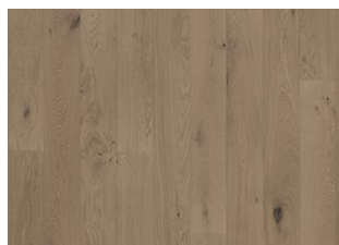
Chêne Frozen Hazelnut Plank