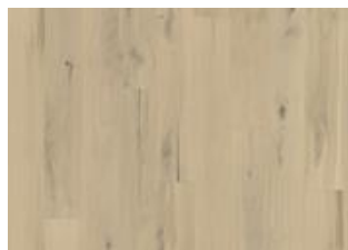
Frosted Oat Plank