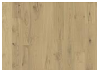
Urban Brown Plank