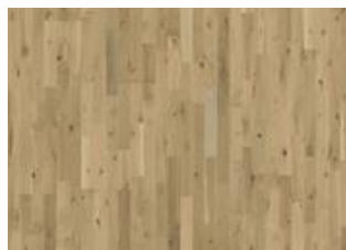
Urban Brown Strip