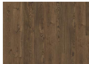
SMOKY CLA 200