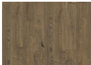
YELLOWSTONE CLA 200