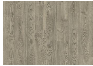
Jasper CLA 200